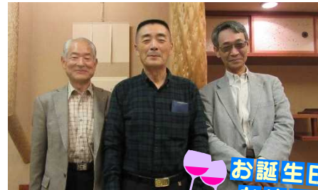
お誕生日 おめでとう