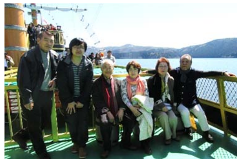
海賊船 箱根芦ノ湖～桃源台