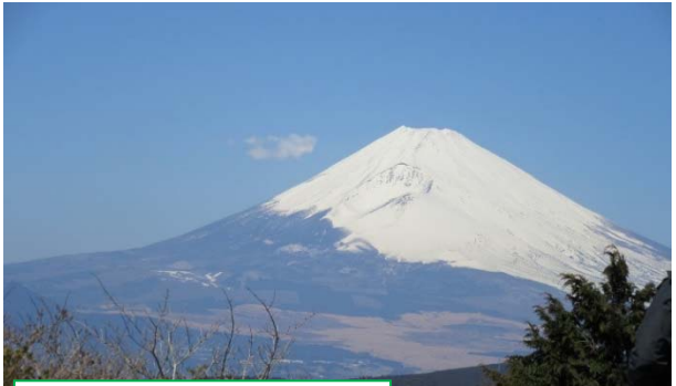
富士山 十国峠にて