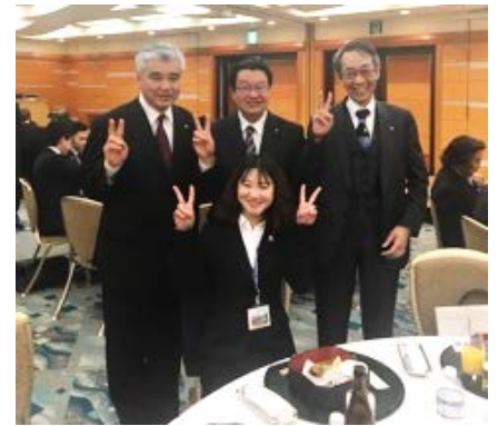
↑米山奨学生修了式にて

最後になりますが、先日、エレクトから電話があり、退院の日は決まっていないようですが、元気だそうです。1日でも早く例会に出ただけできれば幸いです。